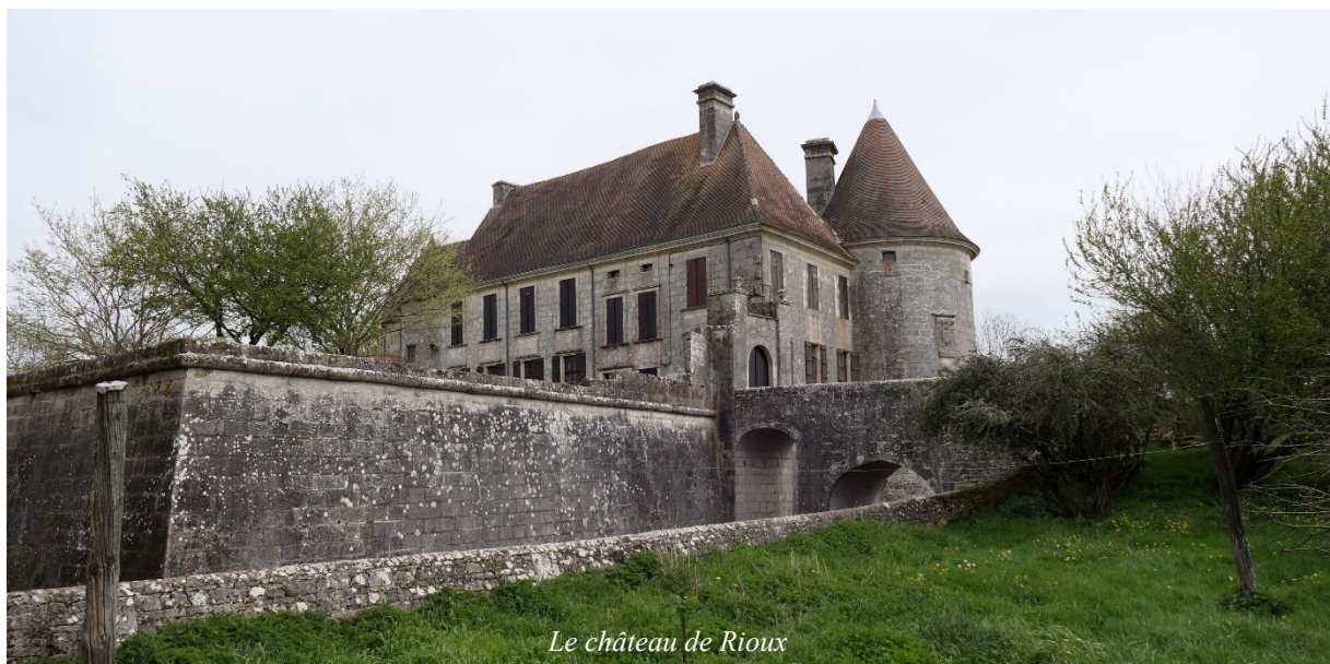
Le château de Rioux